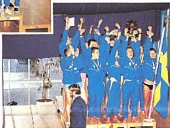
VM-GULD 1991. Damer och herrar i Köpenhamn.