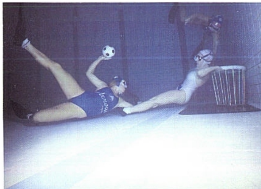
UV-rugby är en tuff sport – men inga ojusta medel är tillåtna.