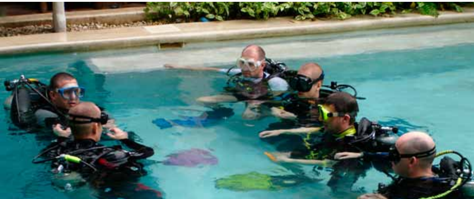
En av tävlingsbassängerna i kommande CMAS Games i Tunis.

från Norge som heter ”Vanmerkena” utgör inspiration i detta projekt.