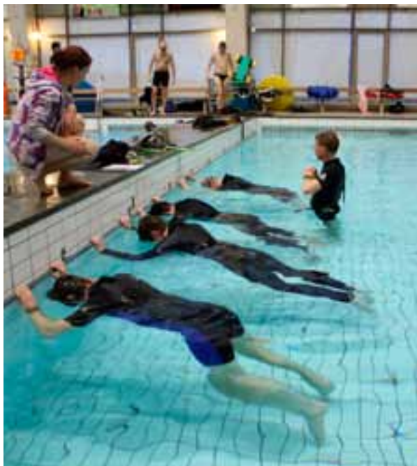
Första provkursen för steg 4-6 instruktör