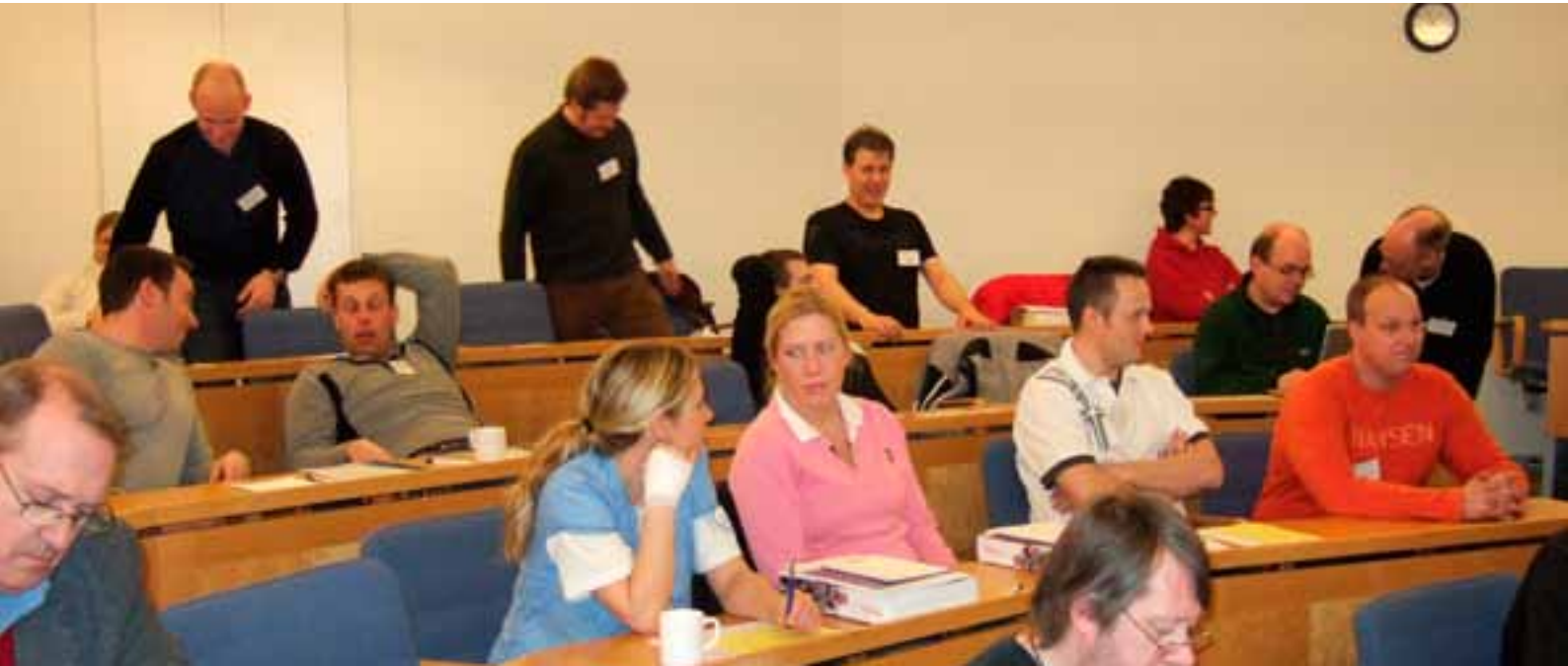
NIT 2009 i Göteborg