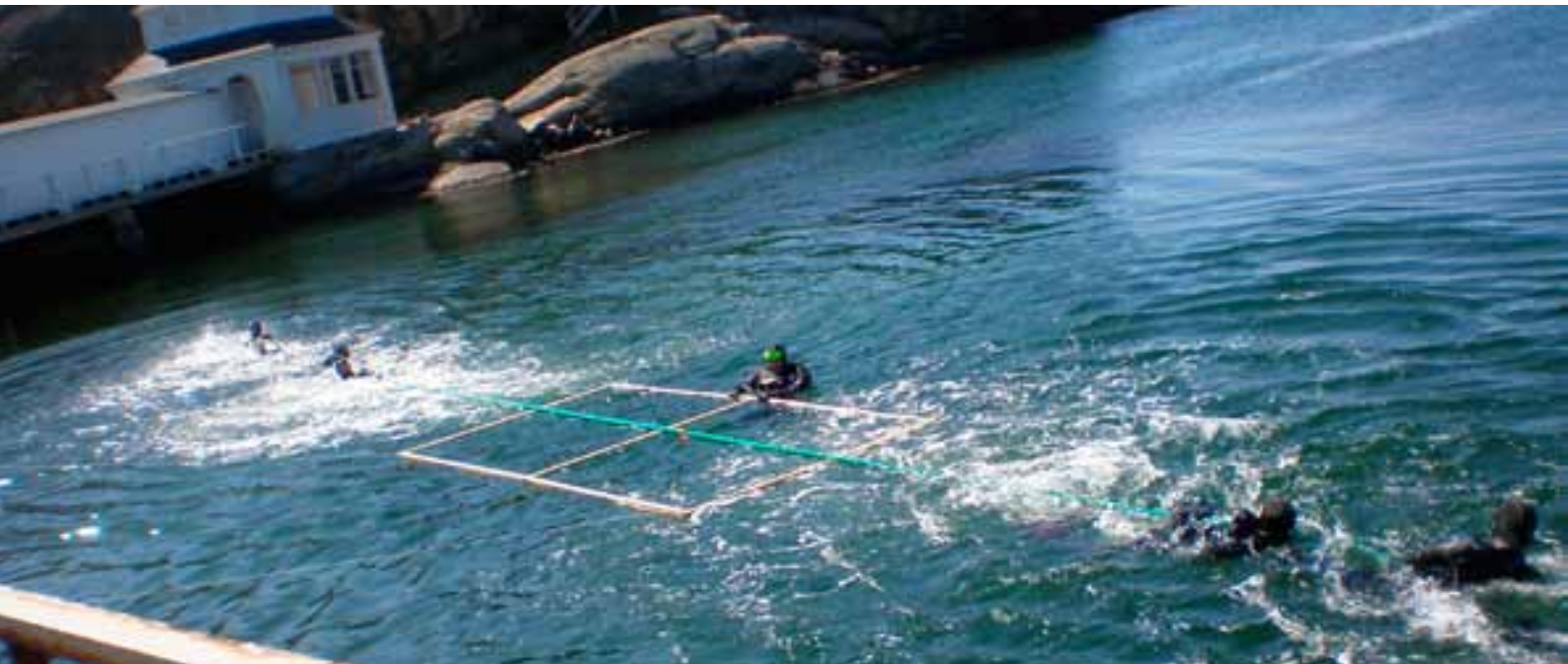
Vattendragkamp på Dykningens Dag i Lysekil