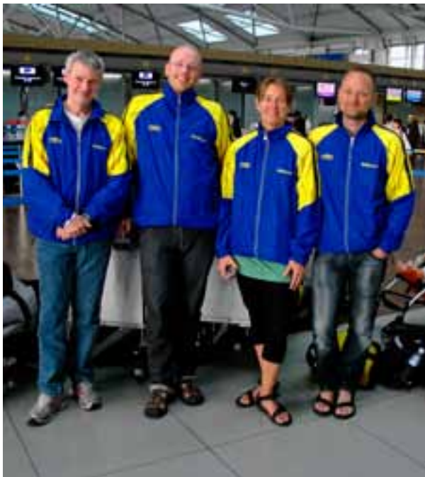
Sveriges UV-fotolandslag på väg till VM i Sydkorea