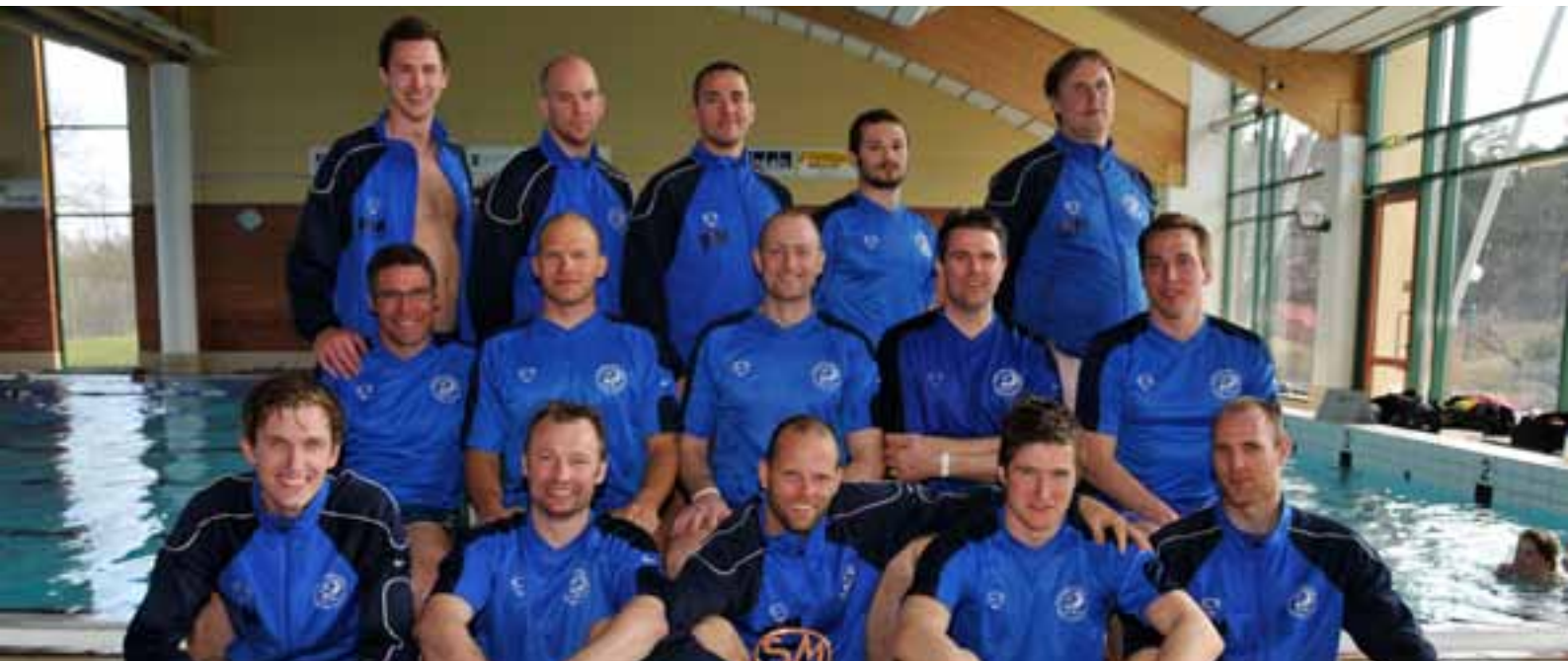
SDK Malmö-Triton tog SM-guld för herrar

Efter att Sydkusten 2008 bröt SDK Malmö-Tritons segersvit på sju raka mästerskap (tangerat rekord, delat av Linköping) återtog SDK Malmö-Triton återigen guld efter en jämn final mot Polisens DK. På damsidan tog det nybildade laget Felix Flix/Musslorna sitt första SM-guld.