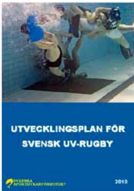
SSDF Utvecklingsplan för UV-rugby gick ut på remiss