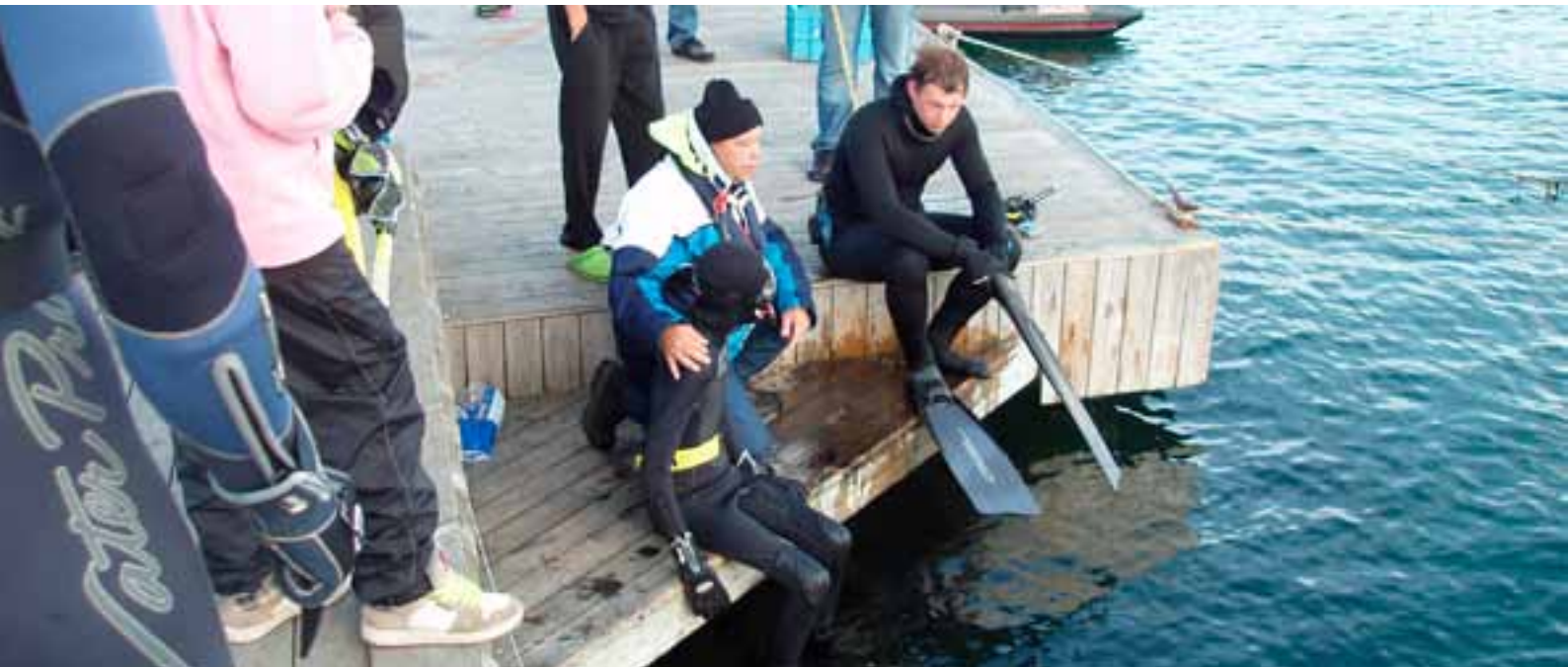
Fridykarlägret på Västkusten