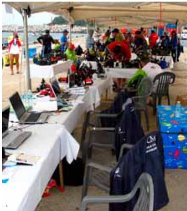
VM i UV-foto i Sydkorea